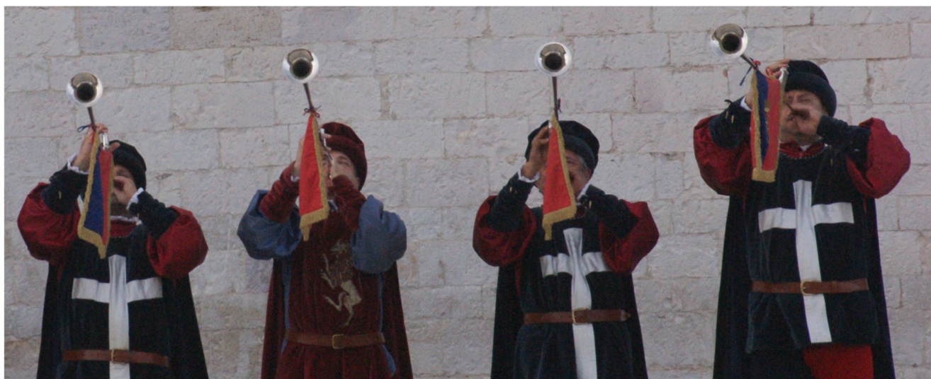
Der indkaldes til generalforsamling